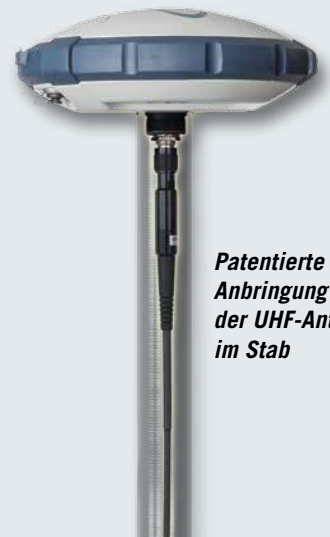
Patentierte Anbringung der UHF-Antenne im Stab