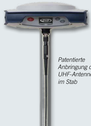
Patentierte Anbringung der UHF-Antenne im Stab