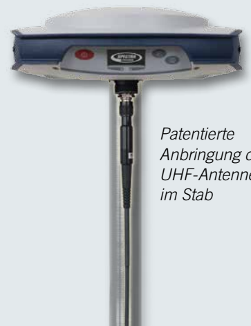
Patentierte Anbringung der UHF-Antenne im Stab