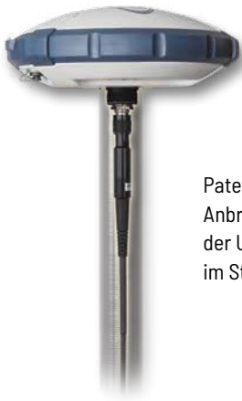
Patenterte Anbringung der UHF-Antenne im Stab