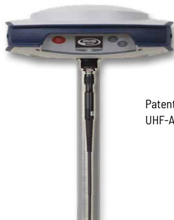
Patentierte Anbringung der UHF-Antenne im Stab

Der SP80 kombiniert unterschiedliche Kommunikationskanäle, darunter ein integriertes 3.5G-GSM/UMTS-Modem, Bluetooth und WLAN. Optional ist auch ein internes UHF-Sendefunkmodem erhältlich. Das GSM-Modem kann für SMS (Textnachrichten) und E-Mail-Benachrichtigungen genutzt werden, ermöglicht aber auch normale Internet- und VRS-Verbindungen. Natürlich kann der SP80 alle verfügbaren RTK-Korrekturen über WLAN-Hotspots (sofern verfügbar) beziehen und Verbindungen zum Internet herstellen. Das interne UHF-Sende/Empfangsmodem ermöglicht die schnelle und einfache Einrichtung einer örtlichen Basisstation. Das spart Zeit und erhöht die Messproduktivität.